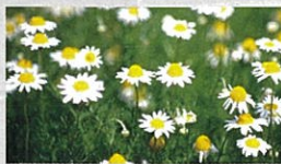
ローマンカモミール 常緑・多年草で葉にも芳香がある。花期以外はカーペット状に広がる。