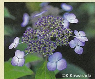
「ヤマアジサイ」 「青花」(ガク咲き)