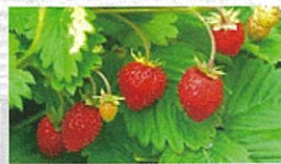
ワイルドストロベリー 常緑・多年草で育てやすい。葉をハーブティーに。