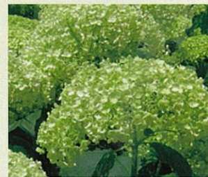
「アメリカアジサイ」 「アナベル」