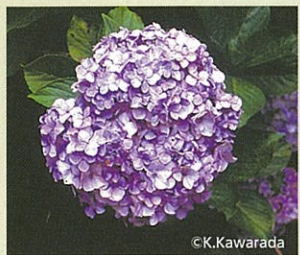
「ガクアジサイ」 「ホンアジサイ」(テマリ形)