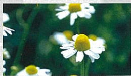
ジャーマンカモミール 1年草で葉には芳香がない。花中心の黄色の部分が盛り上がる。

ハーブにはたくさんの種類がありますが、基本のおすすめは、やはり、ローズマリー、タイム、カモミール、ミント類、バジル、ワイルドストロベリーです。性質や植える場所を参考に育ててみてはいかがでしょうか。