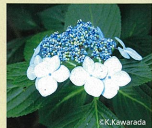
「ガクアジサイ」(原種)